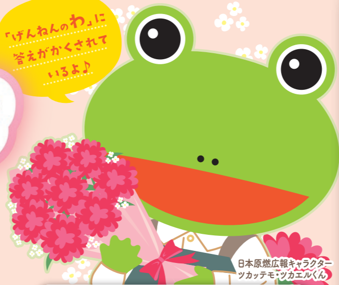
日本原燃広報キャラクター ツカテモ・ツカエルくん